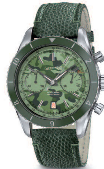
Eberhard & Co, Contograf Special Edition