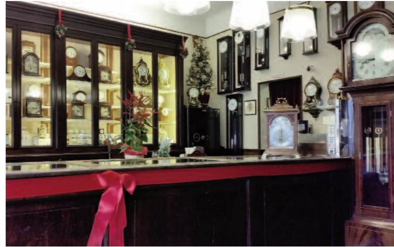
Le vetrine dell'Orologeria Sangalli, in Via Bergamini 7, a pochi passi dal Duomo di Milano. A DESTRA: Molto vasto il catalogo di pendole di ogni tipo di cui dispone il punto vendita. Numerosi anche i marchi di orologeria da polso di cui è concessionario.

Ritrovarsi da turista a passeggiare per il centro di Milano può riservare delle piacevoli sorprese: è quello che accade quando ci si imbatte in negozi come l'Orologeria Sangalli di Via Bergamini, specializzata nella commercializzazione e restauro di orologi a pendolo e cucù, articoli di nicchia e di non facile reperibilità. Ma la sorpresa più grande arriva una volta varcata la soglia del punto vendita: gli arredi interni riportano alla memoria le orologerie di un tempo, con il classico soffitto a cassettoni finemente decorato, l'antico tavolo da lavoro in legno, che reca i graffi e le scalfitture degli orafi che si sono succeduti negli anni, e le numerose pendole di ogni misura e modello che si offrono da ogni angolo del negozio agli sguardi del visitatore. L'assortimento dell'Orologeria Sangalli comprende anche modelli da polso: dagli orologi di fascia media ai segnatempo delle marche più prestigiose - Baume & Mercier, Longines, TAG Heuer e Zenith, solo per citarne alcune.