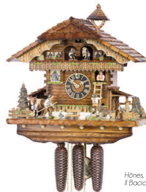
Hönes, Il Bacio Rubato

Contograf Special Edition, riedizione della creazione omonima prodotta dalla Eberhard & Co negli anni Sessanta: del modello vintage mantiene gran parte dei tratti originali, integrandoli con dettagli innovativi come la lunetta in ceramica con rotazione unidirezionale e il cinturino in pelle; è animato dal calibro 8147 su base ETA 7750, meccanico a carica automatica. La rassegna termina con un orologio al femminile, il piccolo ed elegante Tissot Lovely che è in grado di offrire grande comfort al polso: il tocco glamour è accentuato dal ricorso a una fila di diamanti sulla lunetta e dalla delicata madreperla bianca del quadrante: il movimento è l'ETA 901.001.