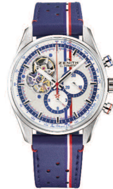
Zenith, Chronomaster 1969 Tour Auto Edition