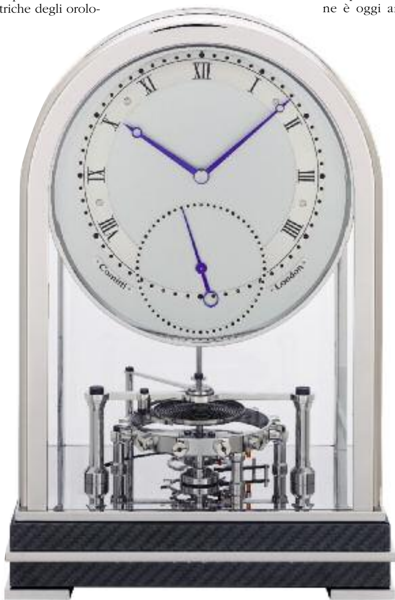
The Meridian Co-Axial Table Clock. È la nuova pendola da tavolo, firmata da Comitti of London, con scappamento Daniels.