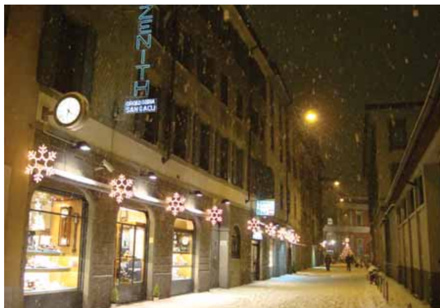
Una suggestiva immagine dell'orologeria Sangalli sotto la neve. Il negozio si trova in Via Bergamini 7, a Milano.