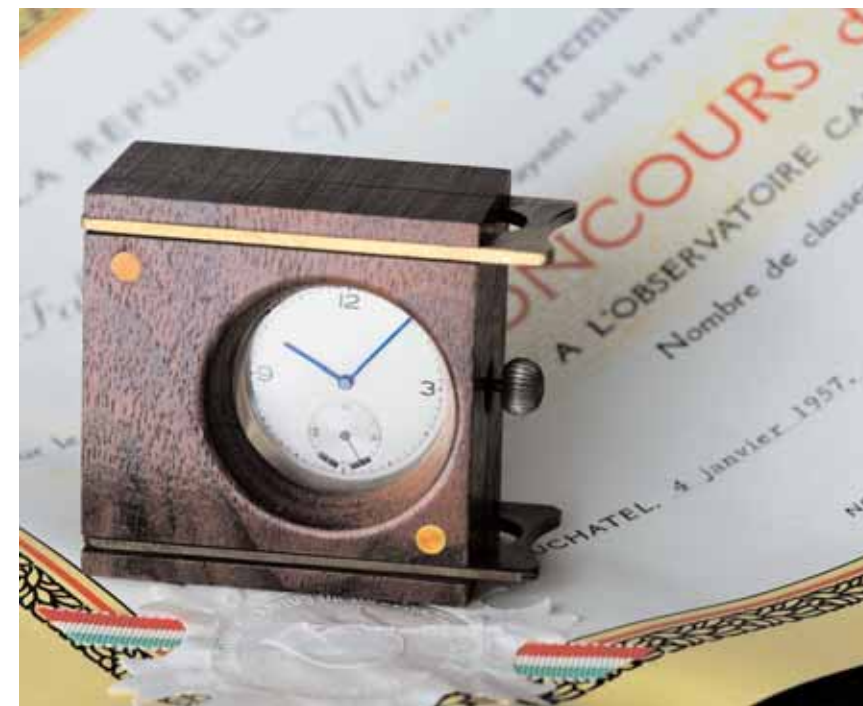
Il Calibro 135, lanciato nel 1948, si è aggiudicato numerosi premi per la cronometria durante i diversi concorsi indetti dall'Osservatorio di Neuchâtel, cinque dei quali sono stati vinti in anni successivi, dal 1950 al 1954.